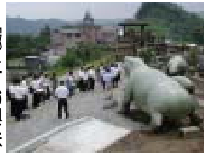
西秩父を支える人材を育む「中高一貫教育」の事業として、第八回校外学習講座が、本年度も本夏休み中に実施されます。