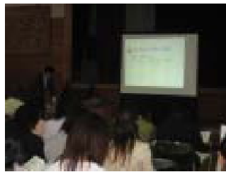
プロジェクターを使用した説明

五月十九日に保護者を対象に「学校説明会」を実施しました。学校説明会の内容は以下の通りです。