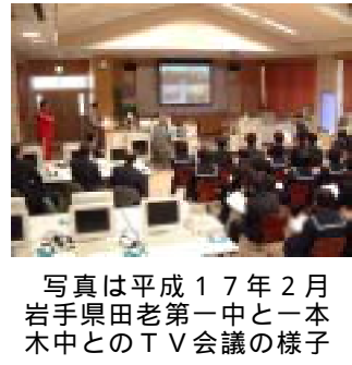
写真は平成17年2月と17年中一の岩手県老田第一中学校とのTV会議の様子

夏休みまでにPTA行事として、例年実施している合同懇談会を七月十四日に、二十二日には奉仕作業・バザーを予定しています。中高連携として、今年度はTV会議システムを活用し、小鹿野高校との実践、九州地区の水族館との理科の授業実践を予定しています。