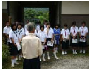
出浦家の古文書は、今にも切れそうで大切に扱っていました。何て書いてあるのか解らなかつたけど、歴史の古さを感じました。

配布されたテキストや説明を聞き、どこも歴史を感じました。甲源一刀流という流派の開祖が両神にあつたことに驚きました。逸見道場は木造平屋で歴史を強く感じました。